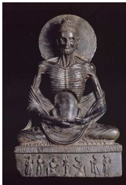
"Como una maroma retorcida eran las vértebras de mi espina dorsal... Como vigas desvencijadas de un techo desplomado, así estaban mis costados marchitos." Arte de Gandhara (s. II).