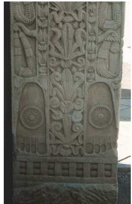
Plantas de los pies del Buda ( buda-pada ) con ruedas del darma en el centro. Los dedos apuntan hacia abajo para indicar que el Buda se halla de cara al observador. Estupa de Sanchi (s. III a. C.).