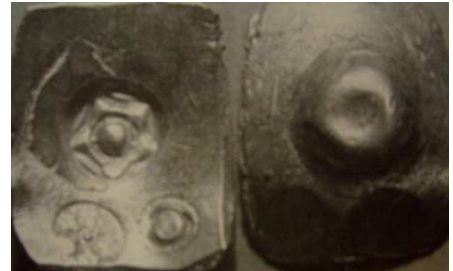
Moneda de plata troquelada, utilizada en la república Sakya (hallada en Narhan, Uttar Pradesh, India, ss. V ó VI a. C.). La marca central es de origen, las laterales fueron añadidas por los banqueros.

Según las últimas investigaciones históricas, Siddharta ("aquel que ha realizado su propósito") no fue príncipe, sino un guerrero ( ksatriya ) del clan Sakya, ubicado en la cuenca del Terai (Nepal). Su probable año de nacimiento es el 480 a. C., en Lumbini, cerca de Kapilavastu, la capital de los Sakya. Fue el primogénito del jefe Suddhodana ("arroz puro") y su esposa Maya ("misterioso poder espiritual"). Su nombre de familia era Gautama. El clan Sakya era una