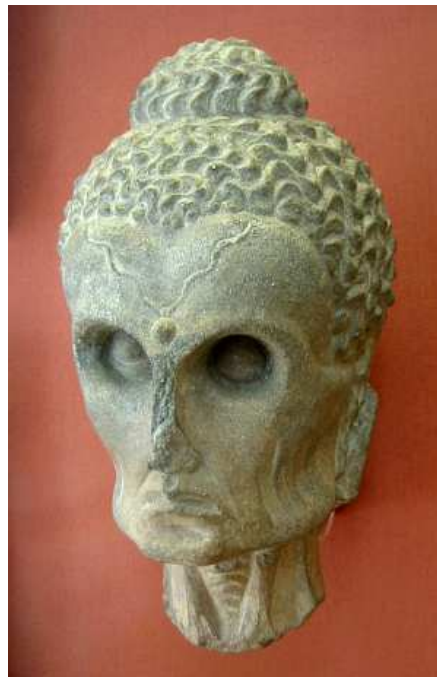
"Como brillan en el fondo del pozo los destellos de las estrellas, así brillaban mis ojos en la profundidad de mis cuencas." Arte de Gandhara (s. II).

Acompañado por cinco ascetas, Gautama se dirigió al monte Uruvela (actual Gaya). Allí pasó seis años dedicado a lo que él denominó "la cuádruple vida superior": "he sido asceta de ascetas; he sido repugnante, el mayor en la repugnancia; he sido escrupuloso, el mayor en la escrupulosidad; he sido solitario, el mayor en la soledad." Su ascesis incluía ir desnudo, alimentarse de inmundicias, vestir