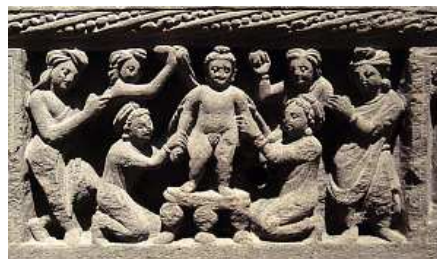
"En el palacio del monzón era entretenido por juglaresas sin que hubiese ningún hombre entre ellas." Arte de Gandhara (s. II).

Sin embargo a los veintinueve años, Siddharta tuvo la extraña sensación de no hallarse satisfecho con su vida. Su exclusiva dedicación al placer no le había aportado ningún sentido a su existencia, sino al contrario, una punzante desazón anidaba en su corazón junto a la certeza de que todo aquello era inconsistente, vano. Súbitamente tomó aguda conciencia de su frágil e inverosímil situación. Percibió que se hallaba sujeto al envejecer, enfermar y morir, tres experiencias comúnmente conocidas por todos sí, pero que sólo él, Siddharta, las observó con una profundidad inigualada entre sus semejantes. Como consecuencia tuvo una experiencia definitiva de abandono de lo que él mismo denominó como las tres vanidades: vanidad de la juventud, la salud y la vida (las biografías posteriores elaboraron dicho abandono con la leyenda de los "cuatro encuentros": un viejo, un enfermo, un cadáver y un asceta).