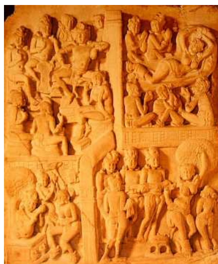
Nacimiento del Buda. Secuencia: (arriba dcha.) sueño de Maya, la madre del Buda; (arriba izq.) los astrólogos interpretan su sueño; (abajo dcha.) el nacimiento del Buda se simboliza por un lienzo con sus huellas de pies; (abajo izq.) Maya presenta a su hijo a la deidad yaksa de los Sakyas. Arte anicónico de la estupa de Amaravati (s. II).