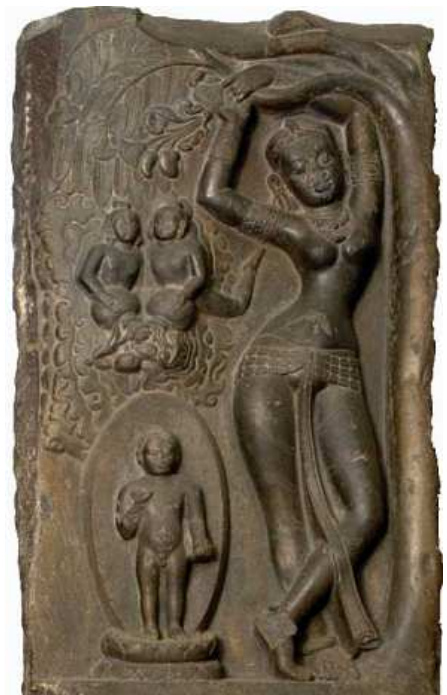
"Cuando el Bodisatva salió del útero de su madre, dos chorros de agua aparecieron desde el cielo, uno frío y otro caliente, para bañar al Bodisatva y a su madre." Arte Pala (s. IX).